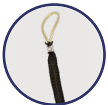
Detalle del sistema de tracción